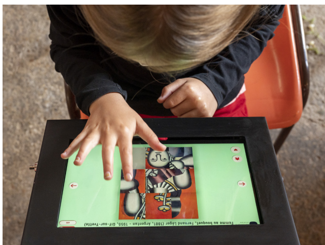
Micro-Folie à la Ferme de Vaux

Ses activités, gratuites, seront à destination de tous les publics.