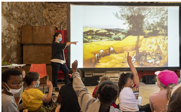
Micro-Folie à la Ferme de Vaux

Ses activités, gratuites, seront à destination de tous les publics.